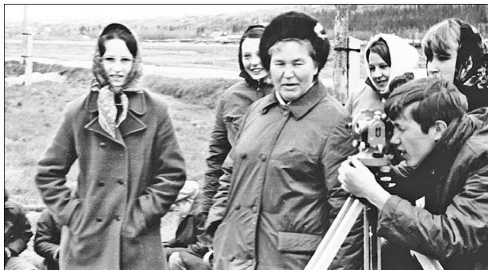
Геодезическая практика студентов УТЛ, 1972 год.