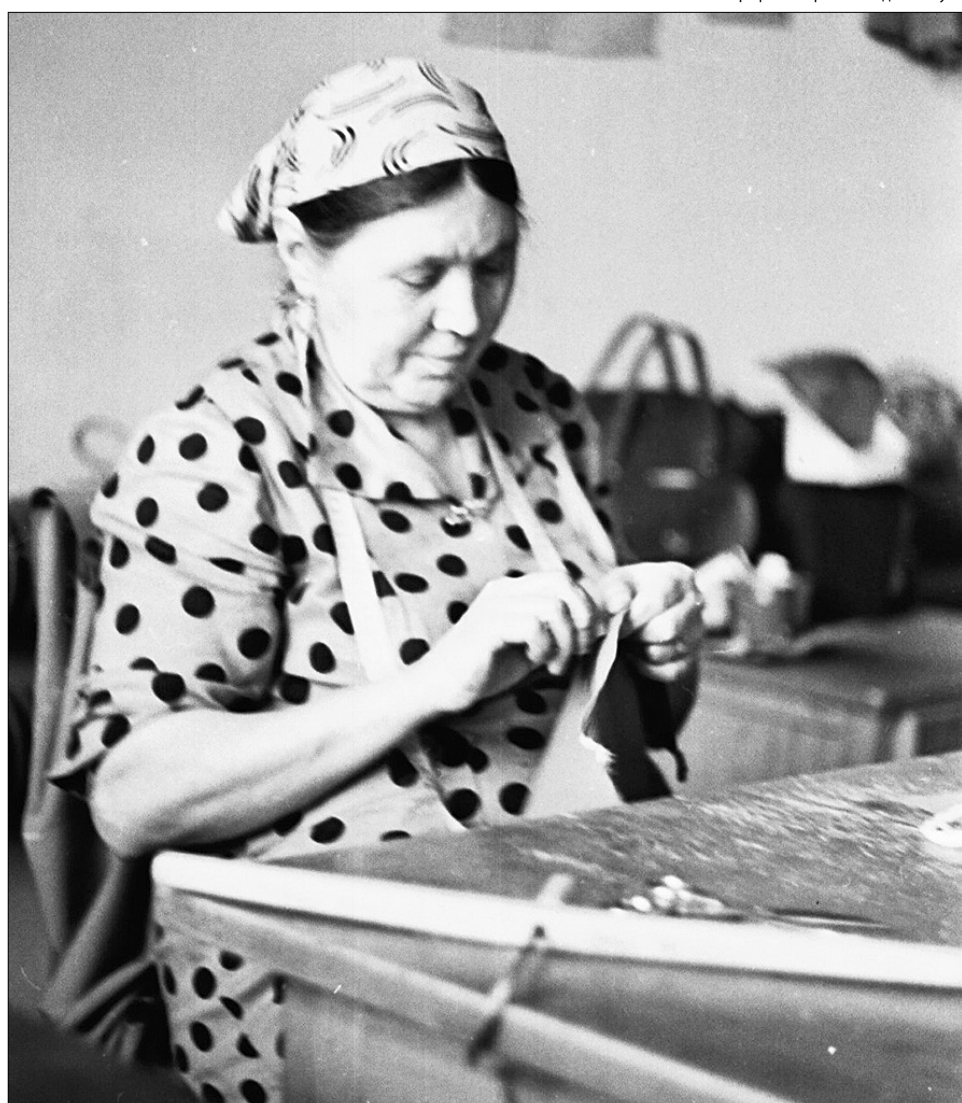
Этот снимок сделан в пошивочном цехе комбината обслуживания. Автор не помнит, где именно он располагался в Ухте, но предполагает, что по улице Октябрьской, 1960 год.

Узнали себя и своих знакомых? Есть что вспомнить? Звоните — 76-13-49.