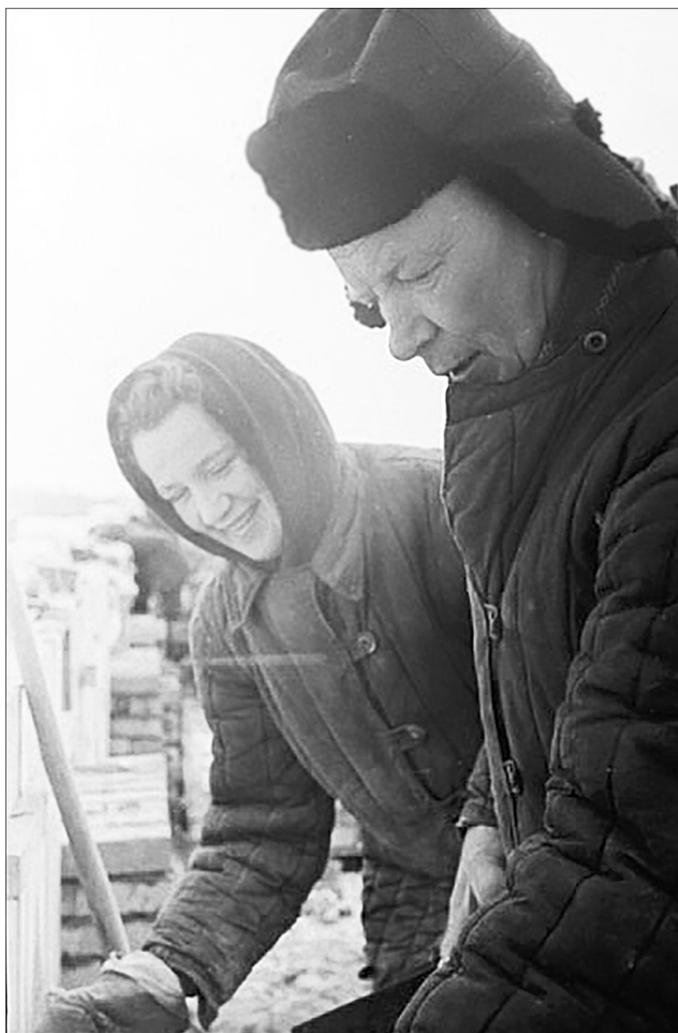
Каменщики на строительстве дома по улице Оплеснина, 1960 год.

Ваши отклики мы будем рады видеть на сайте: www.nersite.ru