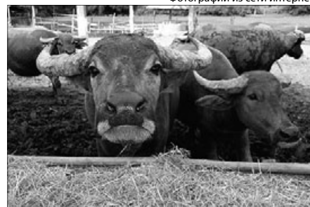
Фотографии из сети интернет

Летом 2015 года сообщалось, что итальянская ассоциация «Браво, Италия!» готова помочь с поставкой в Севастополь оборудования для выпуска сыров из местного сырья. В середине апреля глава итальянского МИД Паоло Джентилони выступил за снятие санкций с