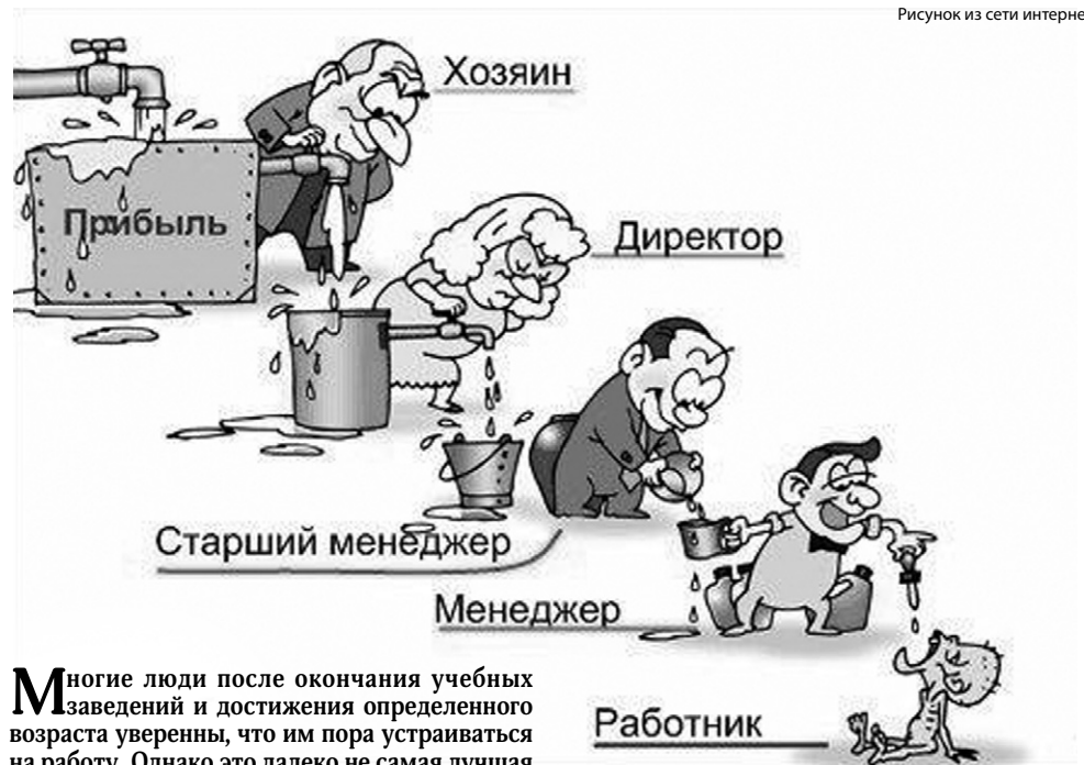
Рисунок из сети интернет

М ногие люди после окончания учебных заведений и достижения определенного возраста уверены, что им пора устраиваться на работу. Однако это далеко не самая лучшая идея. «Почему?» – удивитесь вы. Все очень просто. Существует альтернатива – работать на себя, и несколько причин, почему это надо делать.