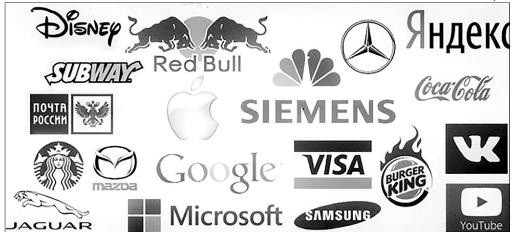
Рис. из сети интернет

Логотип — зеркало души компании. И для судьбы вашей фирмы важно, чтобы это послание было осмысленным и правильным. Удачный логотип сильно повышает узнаваемость бренда и привлекает к себе внимание нужной вам аудитории.