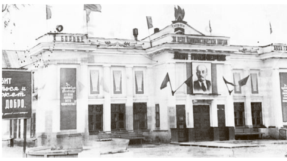
Деревянный Дом пионеров в Детском парке. Все школьные вечера проходили в нем. Здесь показывали кинофильмы, работали различные кружки. Дата съемки и автор неизвестны.