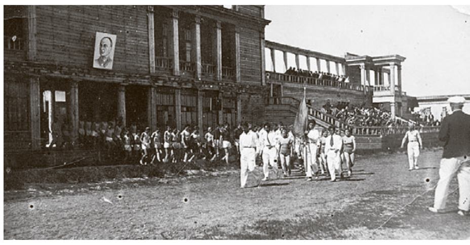
О событии и авторе этой фотографии ничего неизвестно. Вероятно, вторая половина 40-х годов XX века. Начало какого-то футбольного матча на стадионе «Динамо».

Ваши отклики мы будем рады видеть на сайте: www.nepsite.ru